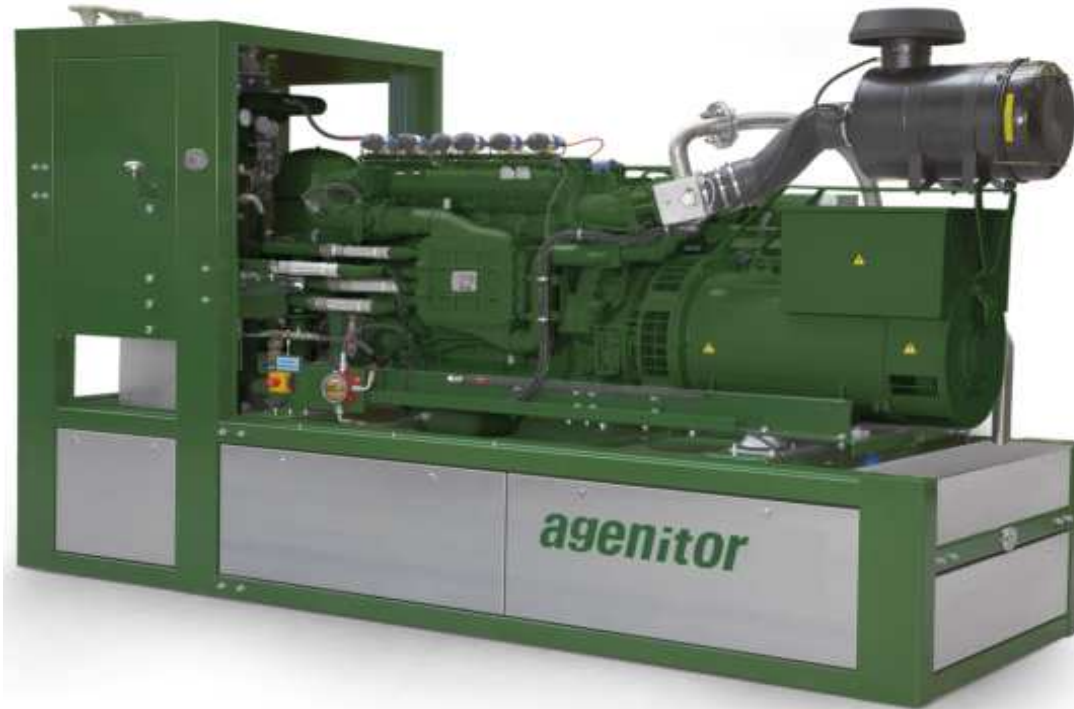
Рис.: Символическое изображение, может отличаться от описанного модуля

Готовая к подключению компактная блочная тепло-электроцентраль состоит в основном из следующих узлов: